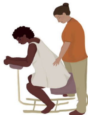
Massagem no cavalinho