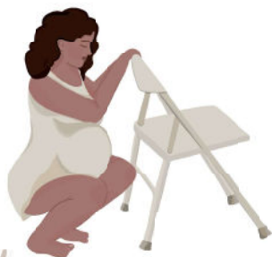
De cócoras com apoio na frente