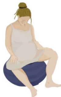
Sentada na bola