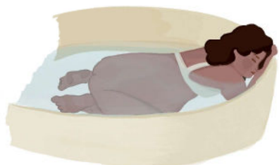
Descanso na banheira