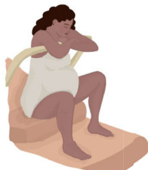
Apoiada no arco