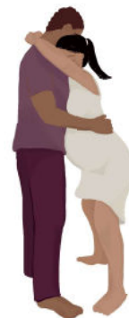
Em pé sustentada