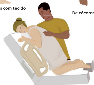
Joelhos na cama (descanso)