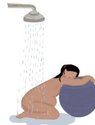
Apoiada na bola