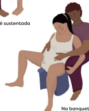
Na banqueta apoiada