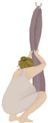
De cócoras com tecido