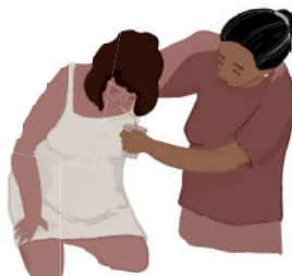
Hidratação livre / Alimentação leve