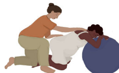
Massagem com apoio na bola